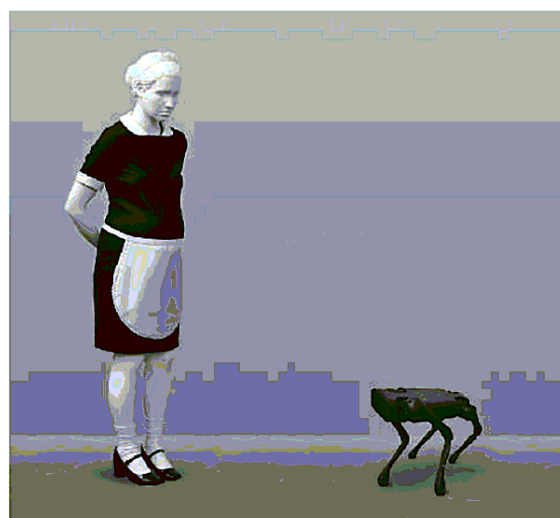
Elmgreen & Dragset, 'Pregnant White Maid and Unitree A1 robot dog', 2017, a Milano