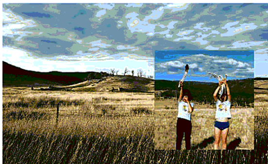
Lumina, 'Progetto Echoes', a Mantova