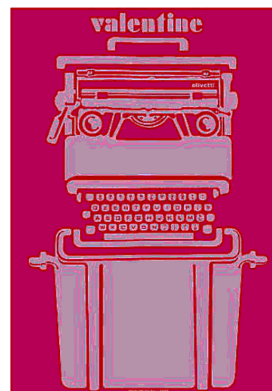
Manifesto della macchina per scrivere Valentine, design Ettore Sottsass per Olivetti, a Parma